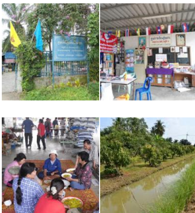
ภาพที่ 2.2 ชุมชนบ้านหัวอ่าว ตำบลบางช้าง อำเภอสามพราน จังหวัดนครปฐม ที่มา: องค์การบริหารส่วนตำบลบางช้าง (2560: ออนไลน์)

มีจำนวนครัวเรือน 185 ครัวเรือน ประชากร จำนวน 711 คน