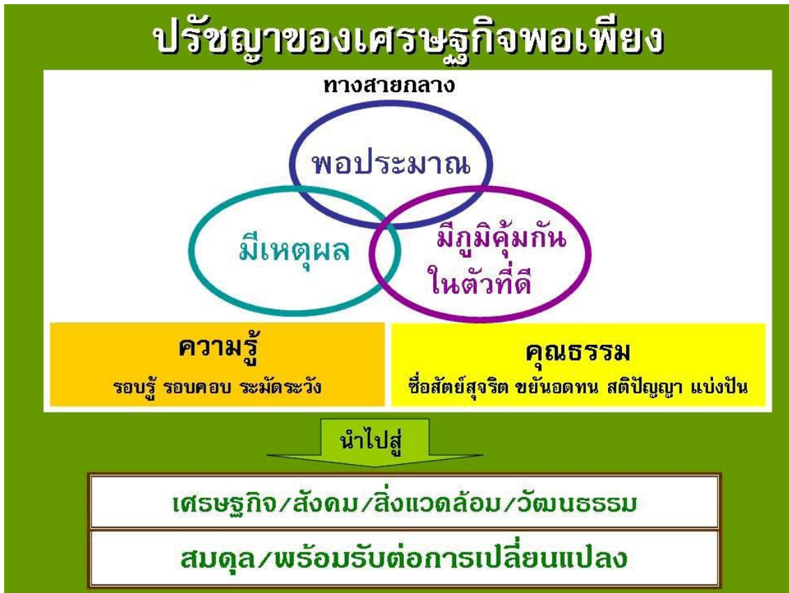
ภาพที่ 2.1 ปรัชญาของเศรษฐกิจพอเพียง